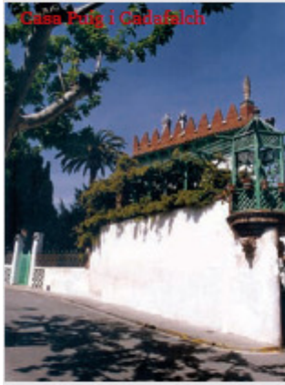
Casa Puig i Cadafalch