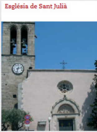
Església de Sant Julià