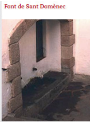
Font de Sant Domènec